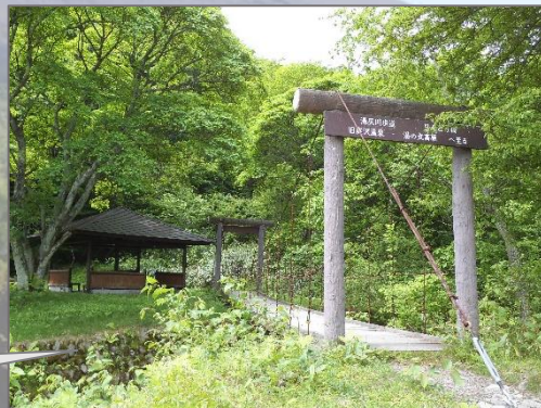
たまだれの滝入り口