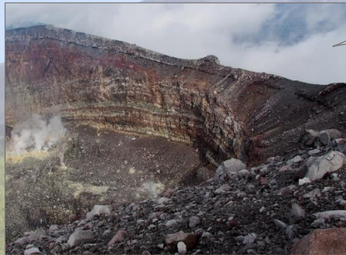
釜山の火口と千トン岩

近年の浅間山噴火によって放出された噴石(岩塊)は、前掛山及び釜山周辺に無数に散在しています。その中でも、「千トン岩」は、1950(昭和25)年9月23日の噴火で噴出された巨大な火山岩塊で、最近の噴火で噴出されたもののうち、現存する最大のものとされています。この時の爆発では、登山者が1名犠牲になるとともに、強い空振で山麓の民家やホテルのガラスの破損が相次ぎ、ガラス屋の在庫が切れてしまったとも言われています。